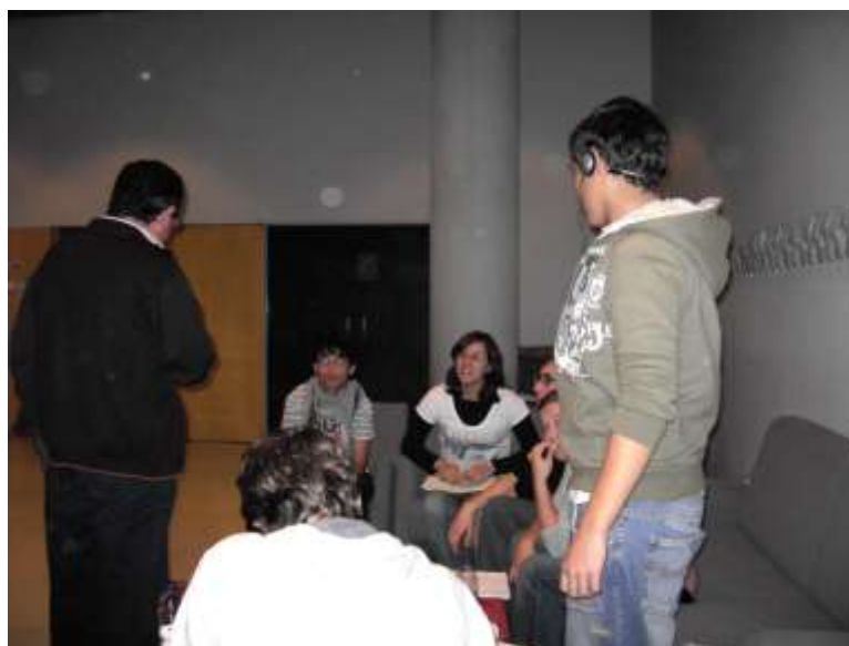
Presentació del Projecte. Lleida 2007